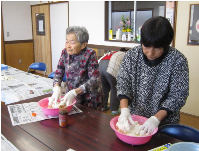
1月24日(金) 手作りホウ酸ダンゴ作りの様子

今年販売元の宿毛授産園にもち米の在庫が少ない為、もち米がなくなり次第もち米の販売をお休みとさせて頂きます。 御入用の方はお早めをお願いします。 販売の再開は未定ですが、再開は「だんだん」でお知らせ致します。