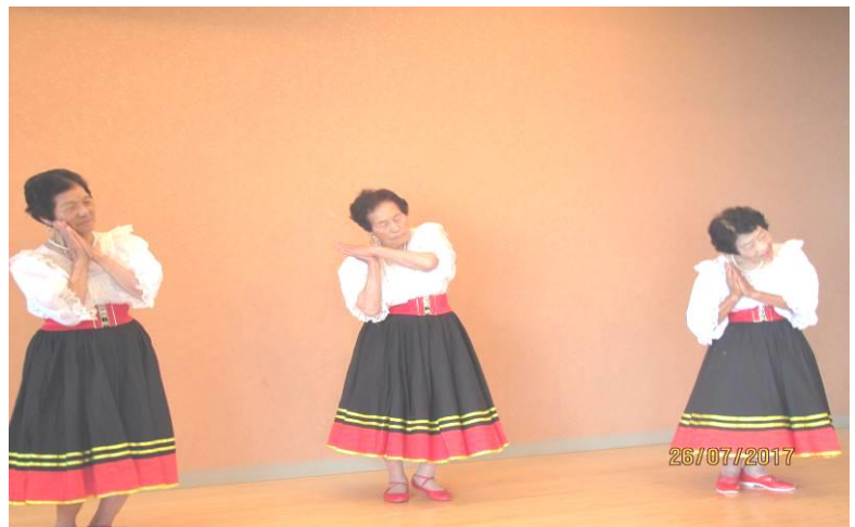
平成 29 年 7 月 26 日、宿毛東部（旧和田）・橋上地区の一人暮らし高齢者の昼食会を行いました。

今回、皆さまから納入された会費は、地域福祉活動を行う経費などのために、有効に活用させていただきます。