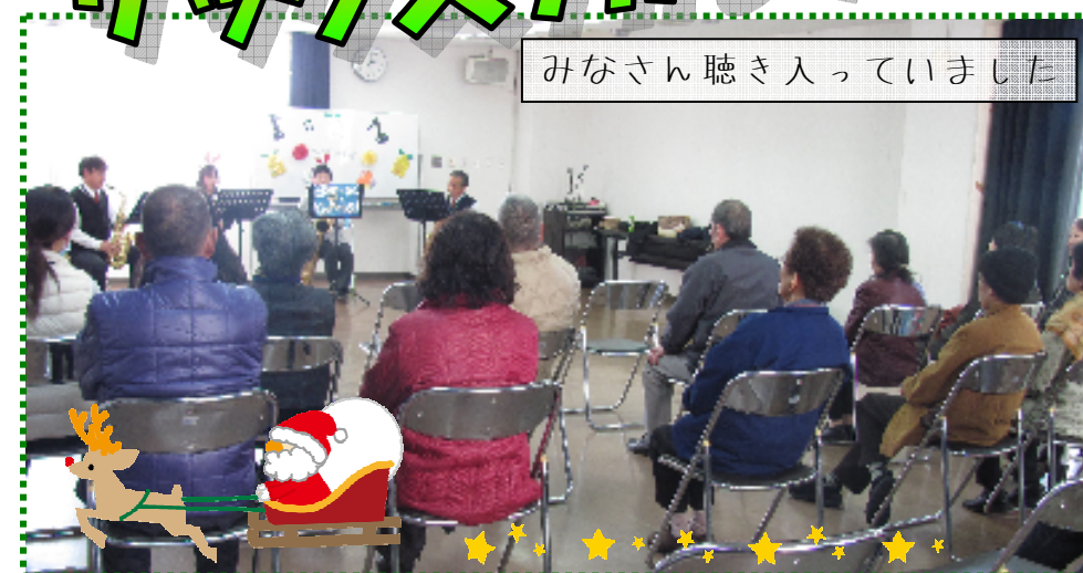
みなさん聴き入っていました

とりする」「生バンドで歌ってみたい！」「踊ってみたい！」「懐かしい曲で涙が出そうになった」など、みなさんからうれしい言葉を頂きました。