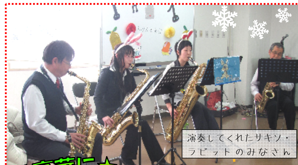
演奏してくれたサキソ・ラビットのみなさん

昨年度のクリスマスにも2名で演奏していただいたのですが、今年は4名での演奏！「人数が増えると音に迫力があるし、音色にもうっ