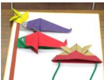
完成品（上写真）真剣に取り組んでいました（右写真）