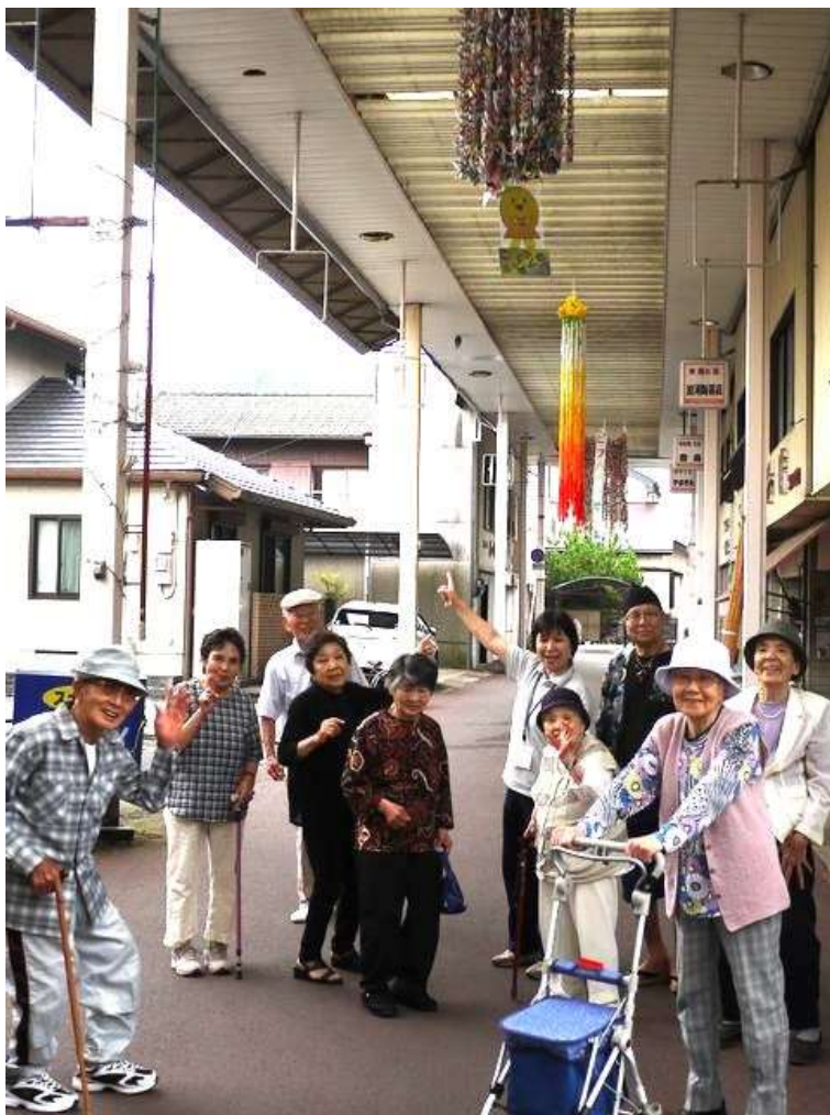
千羽鶴の下で記念撮影。自分たちが作ったものが飾られているのはうれしいですね！