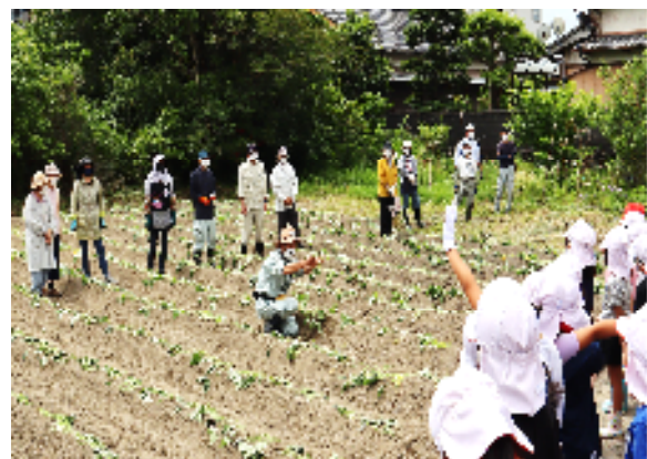
開かれた学校づくりでの芋植え