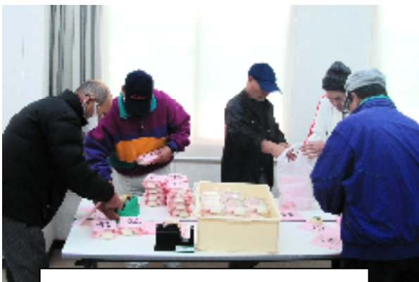
高齢者の方へまんじゅう 配布の準備