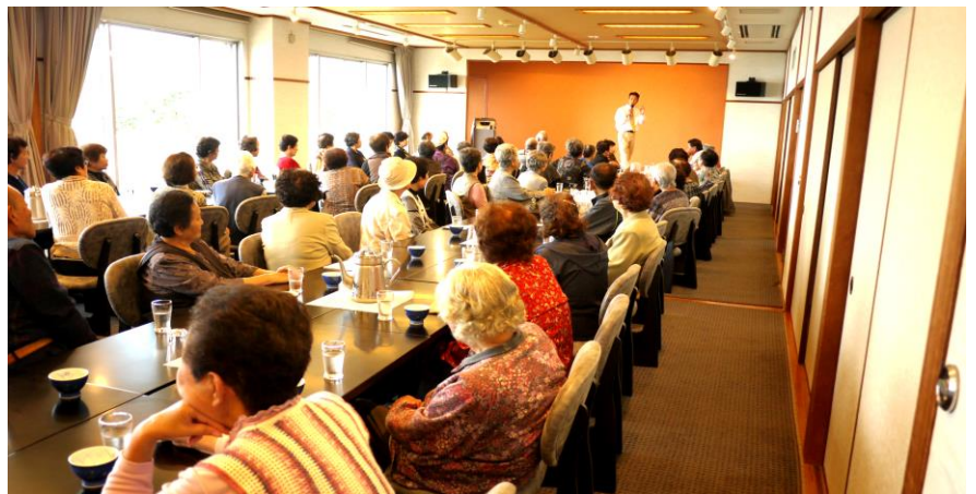
平成 28 年 10 月 26 日、西地区の一人暮らし高齢者の昼食会を行いました。

今回、皆さまから納入された会費は、地域福祉活動を行う経費などのために、有効に活用させていただきます。