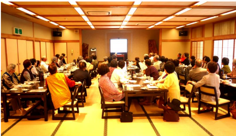
平成 28 年 10 月 17 日、街地区のひとり暮らし高齢者の昼食会を行いました。

昨年 7 月から、各地区長さんを通じて、平成 28 年度の「社協会員」(賛助会員一口 2,000 円、普通会員 200 円)へのご加入のお願いをしたところ、多くの方々にご協力いただきました。ありがとうございます。 社会福祉協議会の行う事業は、補助金や共同募金配分金のほか、寄付金や社協会費など、市民の皆さまのご協力によって支えられています。